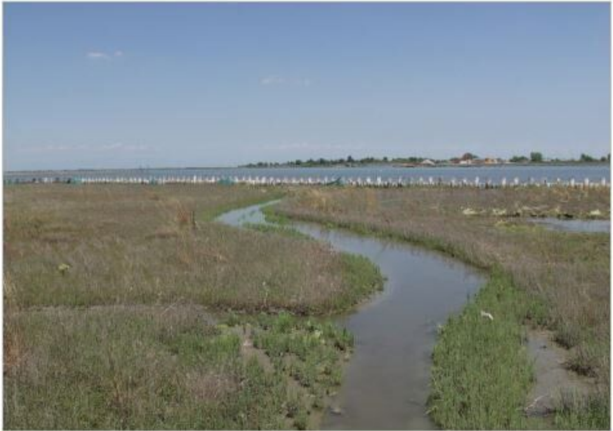
ACCADEMIA DEI LINCEI Fig. 2 Immagine di una barena veneziana ricostruita: un esempio di quella cura costante, costosa ma necessaria a contrastare il degrado barenale indotto da eustatismo, subsidenza e processi erosivi.