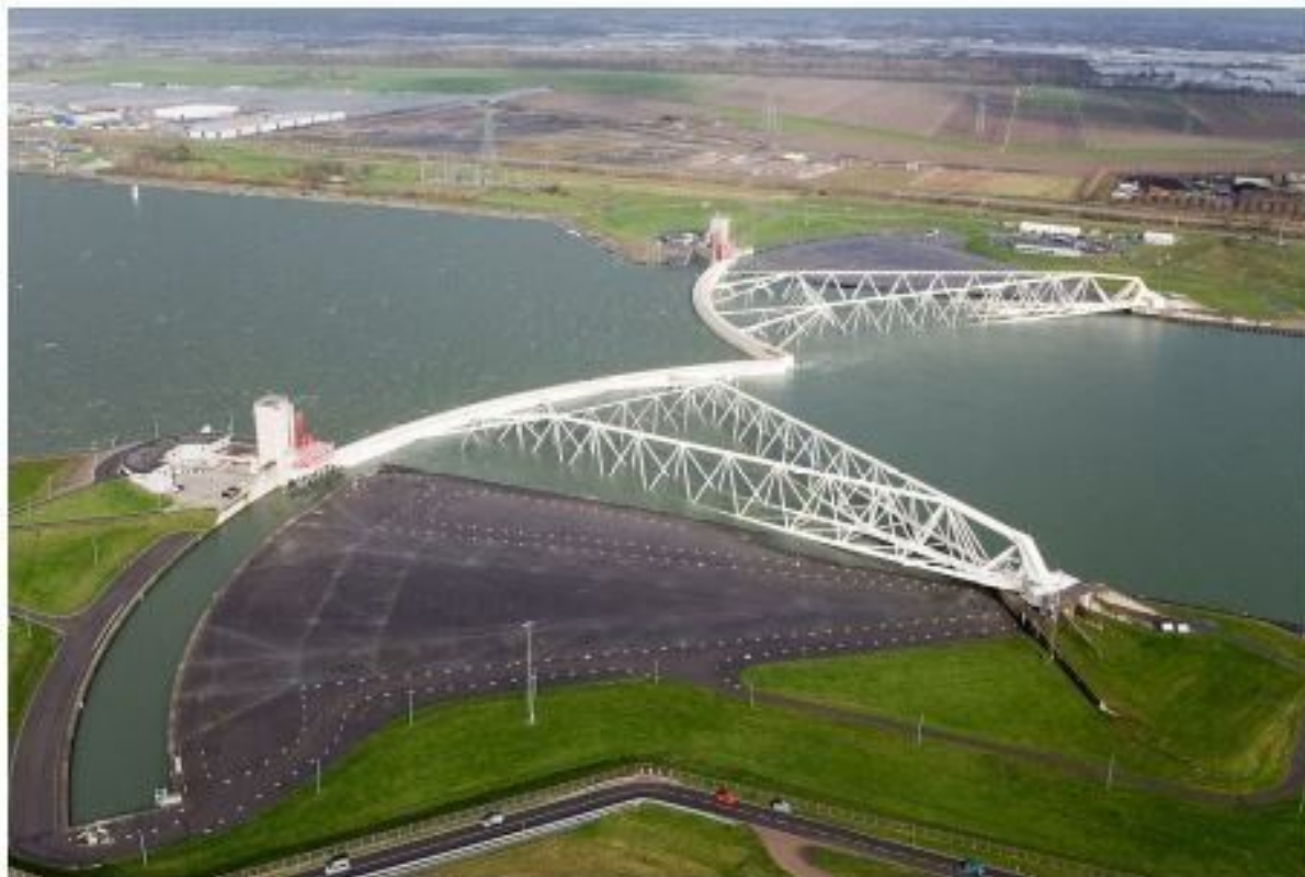
ACCADEMIA DEI LINCEI Fig. 3 Vista aerea delle barriere mobili di Maenslantkering, che proteggono la città di Rotterdam dalle maree eccezionali.

Si tratta di una struttura alta 22 m (più o meno un grattacielo di sette piani) inserita in un canale di larghezza paragonabile a quella delle bocche di porto veneziane. Occorrerebbe l'ironia di Marcenaro per commentare la proposta di adottare una soluzione di questo tipo per Venezia. Avrebbe superato la famosa verifica di impatto ambientale? E come avrebbero reagito il FAI, Italia Nostra e la colta comunità veneziana? La Commissione dei saggi aveva dei vincoli: fra questi quello di minimizzare l'impatto visivo dell'opera, obiettivo perseguibile solo attraverso l'utilizzo di strutture normalmente sommerse.